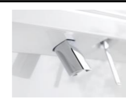
お掃除ラクラク水栓