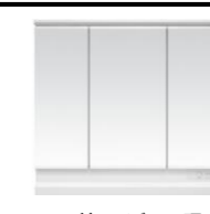
三面鏡・ワイドLED照明（間口900mm）エコミラー